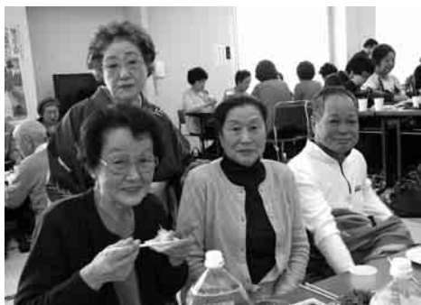
椿さんもあつぱれでした →