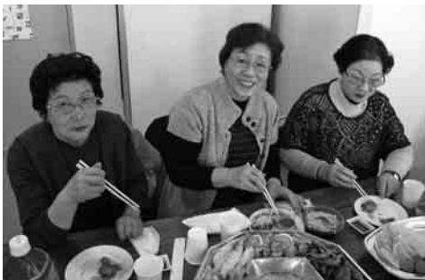
美男美女揃いです ↑→

懇親会では、おいしいような料理に舌鼓を打ち、カラオケではマイクの休む暇がないくらい自慢のものを披露し、メインとも言える全員に景品が当たるビンゴ大会では大いに盛り上がり、ゆっくりと過ぎる和やかな時間を満喫しました。