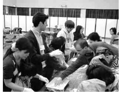
↑本間町長も負けじとがんばります