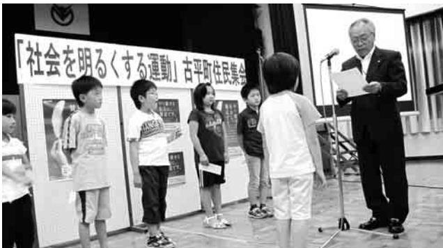
古平町優秀作品の児童に賞状と商品券が贈られました。

7月19日には、古平町住民集会在同館で行われ、保護司、父母、児童生徒ら61名が参加。各学校を通じて募集していた作文・標語応募者の中から古平町優秀作品として入選した30人の児童生徒に賞状と古平町商店振興会の商品券が贈られました。入選作品は次のとおりです。