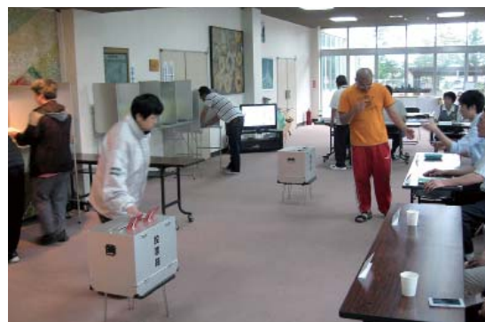
投票所の様子 (第1投票所)