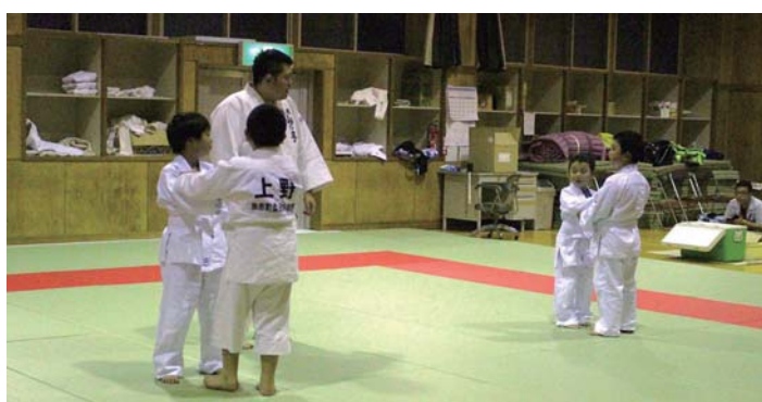
6月28日、武道館での練習の様子

柔道少年団が、毎週火曜日と金曜日に、武道館で練習を行っています。現在、古平町、余市町、積丹町の5歳から中学2年生までの9人が活動しています。