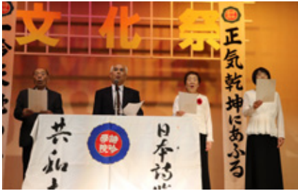
日本詩吟学院丘風会共和支部古平道場