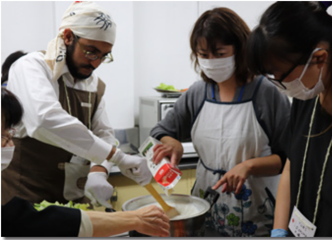
エジプト料理を調理するようす