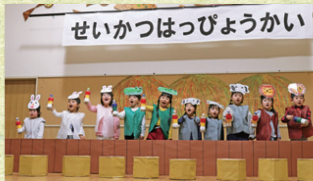
3歳児「もりのおふる」