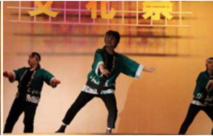
たらつり節踊り保存会