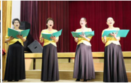
古平女声コーラス「ハイミッシュコール」