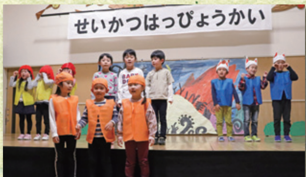
5歳児「めっきらもっきらどおんどん」