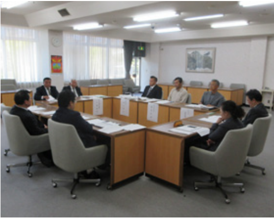
10月10日に開催された協議会のようす

今年度から『古平町空家等対策協議会』を開催し、空き家に関する施策について話し合いました。