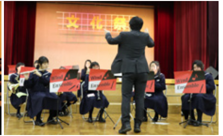
古平中学校吹奏楽部