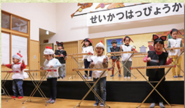
4歳児「プレーメンの音楽隊」