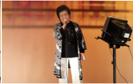
古平カラオケ愛好会