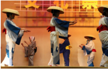
古平正調越後盆踊り保存会