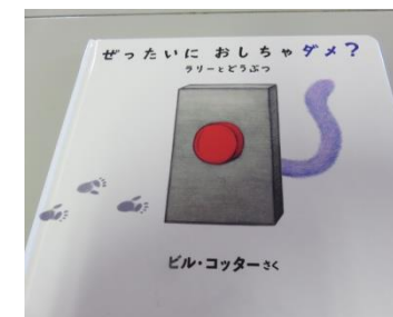
〈ぜったいに おしちゃダメ〉 ラリーとどうぶつ

このえほんには、1つだけルールがあるよ！ それは、このボタンをおしちゃダメ!! ということ。このボタンのことをかंगाえてもダメ!! まもれるかな？