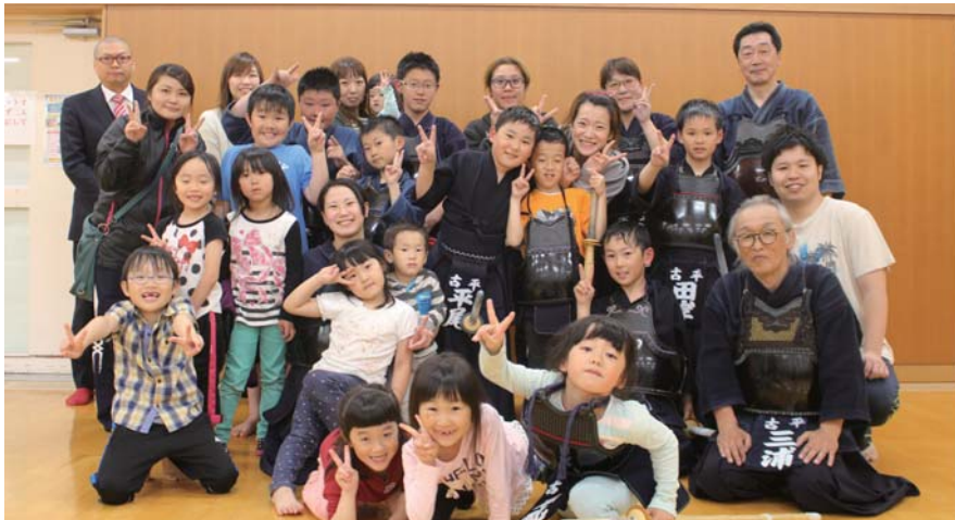
6月8日 練習後の関係者らの集合写真

剣道少年団が、毎週火曜日と木曜日に、B & G 海洋センターで練習を行っています。 現在、5歳から小学校6年生までの10人が、9月頃に行われるB & G主催の大会出場に向けて基本打ち（面、小手、胴打ち）などの稽古に取り組ん