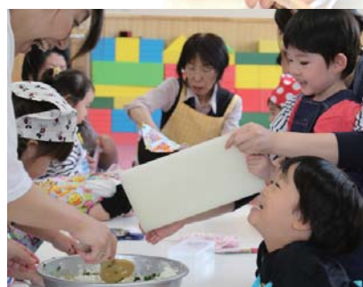
楽しそうに料理する親子たち