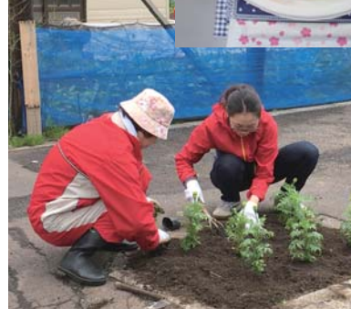
花壇に花植えをする住民