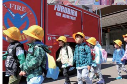
消防車を見学する園児