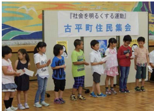
昨年度の住民集会の様子

また、この運動に対する理解を深めてもらうため、次代を担う小・中学校の子どもたちにも犯罪や非行、その立ち直りに関する作文と標語の募集も行います。優秀作品については古平町住民集会で発表、表彰を行います。