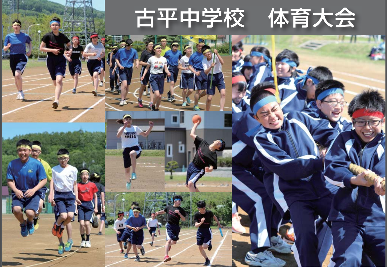
第70回 古平中学校体育大会 新記録