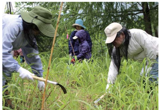
草刈りをする参加者たち

今年の草刈りツアーには同組合の組合員やふるびらの自然を守る会の会員ら約60名が参加し、草刈りの他、森の散策やバーベキューなどを行い交流を深めています。