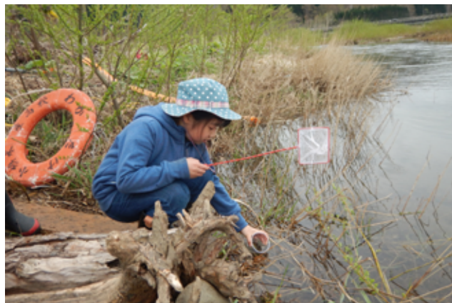
古平川へサケの稚魚を放流するようす

旅立っていったサケの稚魚は北太平洋を回遊し、3・4年後には70cm、3kgほどに成長し古平川に戻ってきます。