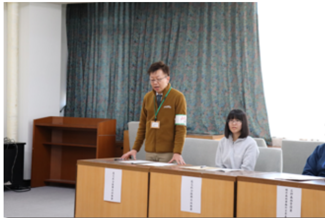
意見を述べる後志総合振興局職員

今年度の対策として、ポスターや注意旗による予防意識の高揚や入林者に対する指導を行うことを話し合っていました。