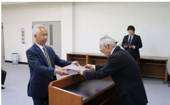
翌日の当選証書授与式