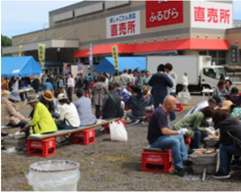
昨年の漁協祭の様子