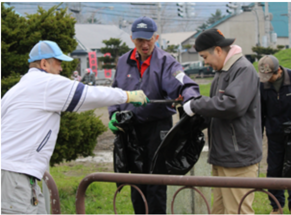
昨年のクリーンフェスティバルの様子