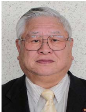
古平町議会議長 逢見輝 続

あけましておめでとございませう。輝かしい平成28年の新春を迎え、古平町議会を代表致しまして心からお慶びを申し上げますとともに、町民の皆さまには、常日頃から町議会に対し深いご理解とご協力を賜り、