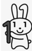
マイナンバーキャラクター マイナちゃん