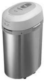
生ごみ処理機のイメージ図