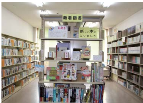
文化会館図書室の新作図書コーナー

町民の皆さまにたくさん図書室を利用していただけよう努めていきたいと思っております。