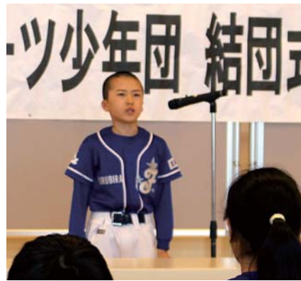
決意表明する入間川海星主将

式後、少年団は余市強い子野球スポーツ少年団と練習試合を行い、14対0で見事勝利を収めました。