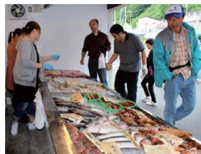
昨年の漁協祭の様子

平成27年度古平漁港東しゃこたん漁協祭が次の日程で開催されます。 ◆ 日時 6月14日、28日、 7月26日、9月27日 午前9時～売切れ次第終了 ◆ 場所 東しゃこたん漁協 生産部前 鮮魚・えび、うに、水産加工品、野菜、果物のほかツブなどの串焼きなどが販売され、買った鮮魚などを焼いて食べるコーナーもあります。